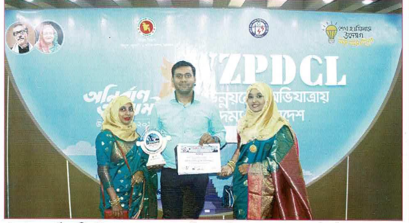
খুলনাসহ চতুর্থ জাতীয় উন্নয়ন মেলায় ওজোপাড়িকোর স্টলে পুরস্কার হাতে কর্মকর্তাবৃন্দ।

খুলনার জেলা প্রশাসনের আয়োজনে সার্কিট হাউজ মাঠ প্রাঙ্গণে সরকারি বেসরকারি দপ্তরের মোট ১৫৬টি স্টল বসে এ উন্নয়ন মেলা। সকল দপ্তর তাদের জনবান্ধব সেবা নিয়ে মেলায় উপস্থিত হয়, তারই ধারাবাহিকতায় পদ্দার এপারের ২১ জেলার বিদ্যুৎ বিতরণকারী প্রতিষ্ঠান ওজোপাড়িকো ও অংশগ্রহণ করে। জনগণের বিদ্যুৎ সেবা সহজীকরণের অংশ হিসাবে ওজোপাড়িকো মেলায় প্রদর্শন করে প্রি-পেইড মিটার ভেঙিৎ পদ্ধতি, এক অবস্থানে গ্রাহক সেবা, টাইম বেইজড কমপ্লেইন ম্যানেজমেন্ট পদ্ধতি ইত্যাদি। এছাড়াও স্টলে বসেই গ্রাহকের নতুন বিদ্যুৎ সংযোগ দেওয়ার ব্যবস্থা করে পদ্দার এপারের বিদ্যুৎ বিতরণকারী প্রতিষ্ঠান ওজোপাড়িকো।