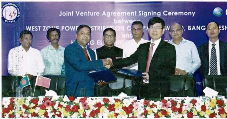
বাংলাদেশ স্মার্ট ইলেকট্রিক্যাল কোম্পানি লিমিটেড-এর চুক্তি স্বাক্ষর অনুষ্ঠানে মাননীয় বিদ্যুৎ প্রতিমন্ত্রী জনাব নসরুল হামিদ, এমপিএসহ অন্যান্য কর্মকর্তাবৃন্দ।